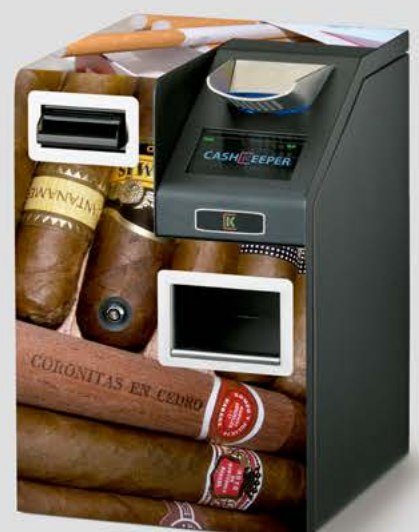
Imanes para soporte publicitario