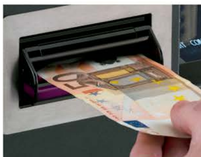
Todos los billetes aceptados son auténticos