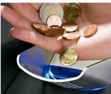
Acepta y verifica 4 monedas por segundo